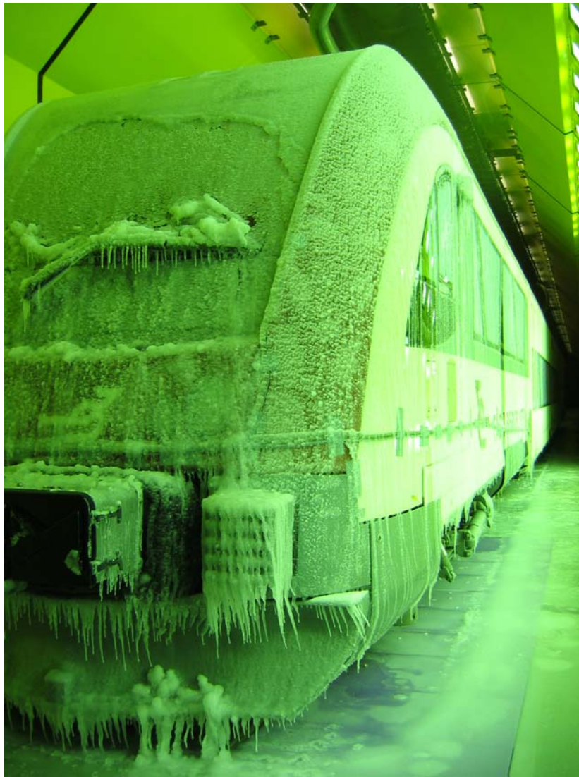
Abb. 1 Schienenfahrzeug unter extremen Klimabedingungen im Klimawindkanal

Einen wesentlichen Platz bei den Versuchen gerade an Schienenfahrzeugen nehmen Aussagen zur thermischen Behaglichkeit ein, geht es doch angesichts der sich verschärfenden Verkehrs- und Klimaproblematik darum, die Attraktivität des öffentlichen Personennahverkehrs auch durch Verbesserung des Komfortangebots zu steigern. Angesichts der Vergleichsmöglichkeiten der Fahrgäste mit dem eigenen klimatisierten Pkw stehen Schienenfahrzeuge hier in einem harten Wettbewerb, den sie auf Dauer nur bestehen können, wenn sie den anspruchsvollen Vorgaben der Automobilindustrie Angemessenes entgegensetzen können.